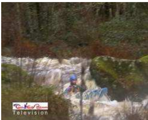
2ème passage (classe 4)