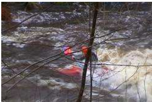
Vague à 400m de l'arrivée