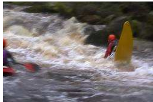
1er passage (classe 4)