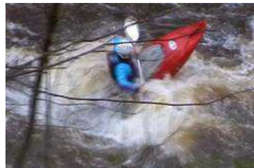
Vague à 400m de l'arrivée