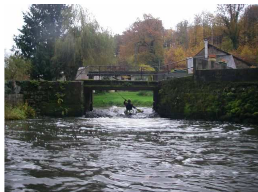
Arrivée seuil de la Basse Rivière en BE