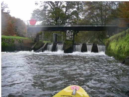
Glissière à prendre sur la droite