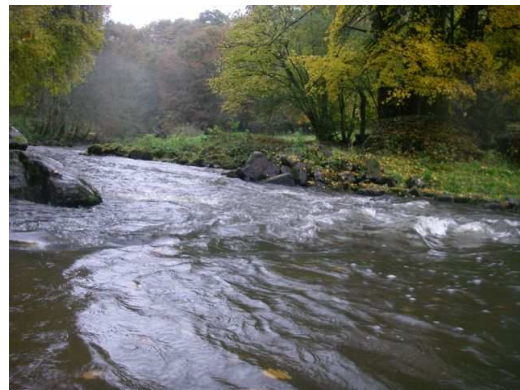
Petit rapide en BE