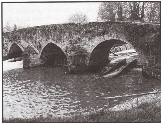
Le Pont et le Moulin d'Antrain.

Vallée sauvage entre des prés plantés de pommiers.