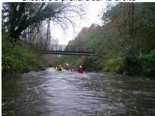
La rivière en BE