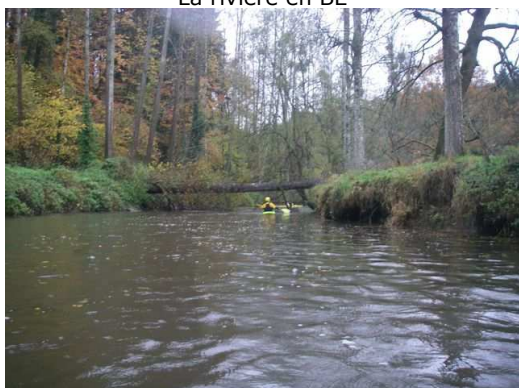
Arbre en travers 200m avant l'arrivée